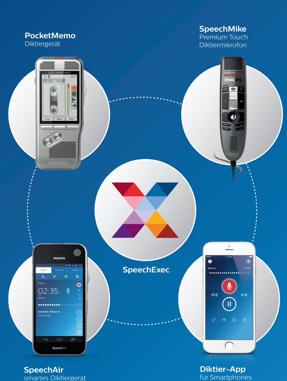
SpeechAir smartes Diktiergerät

Kompatibel mit allen Philips Diktiergeräten